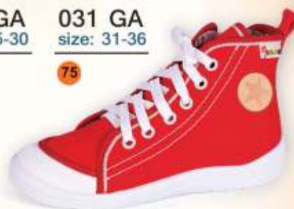
031 GA size: 31-36